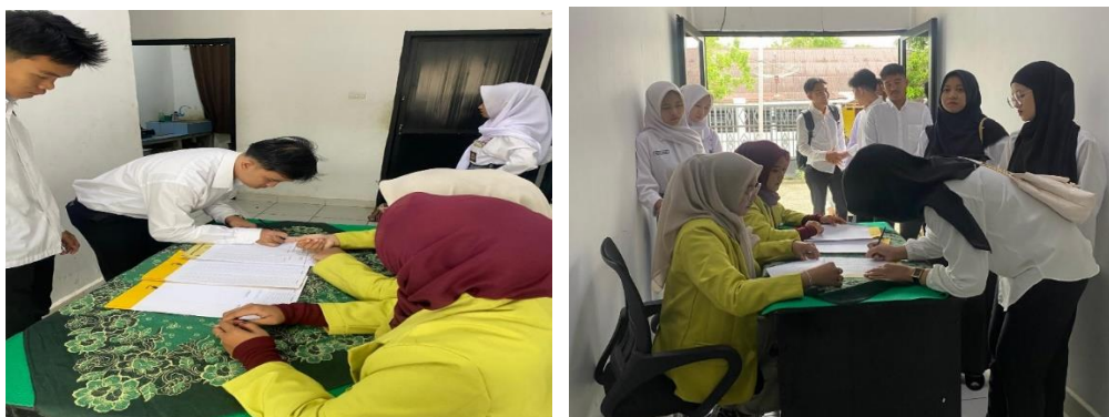
Gambar 2. Sesi pengisian daftar hadir kegiatan pelatihan

kombinasi antara penyampaian materi teoritis dan praktik langsung, yang memungkinkan peserta mengaplikasikan pengetahuan secara nyata selama proses pelatihan berlangsung.