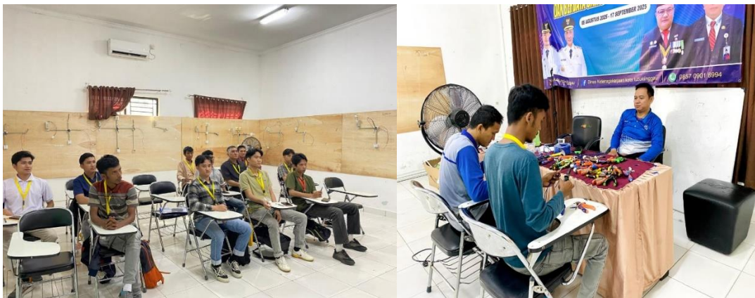
Gambar 1. Pelatihan Keterampilan Praktis

dunia kerja atau sebagai bekal usaha mandiri, sementara pelatihan konten kreator membuka peluang kerja baru di sektor digital yang terus berkembang. Secara keseluruhan, hasil kegiatan ini menunjukkan bahwa integrasi antara pendataan pencari kerja melalui AK-1 dan pelaksanaan pelatihan kerja mampu meningkatkan partisipasi masyarakat serta menjadi langkah awal dalam memperkuat daya saing tenaga kerja lokal.