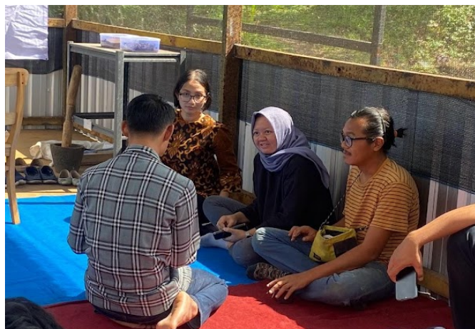
Gambar 5. Diskusi pemanfaatan cacing tanah

Adanya kegiatan penyuluhan inovasi produk tepung cacing tanah membuat pemilik Kharrsa Farm lebih memahami kegunaan serta kandungan cacing tanah. Pemilik Kharrsa Farm menyadari bahwa budidaya cacing tanah berpotensi untuk dikembangkan lebih besar. Tim doktor mengabdikan dan Kharrsa Farm juga melakukan beberapa diskusi terkait peluang usaha pengolahan cacing tanah, sebagaimana yang terlihat pada Gambar 5.