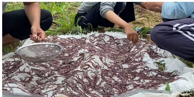
Gambar 8. Penjemuran cacing

Cacing yang sudah terpisah dari lendirnya, disebar di atas alas karung. Kemudian, cacing dijemur di bawah sinar matahari selama 2 jam. Tujuan proses penjemuran ini adalah untuk mengurangi kadar air yang ada dalam tubuh cacing. Jika tidak ada oven untuk proses pengeringan, dapat dilakukan dengan penjemuran dibawah sinar matahari selama 24 jam sampai cacing benar-benar kering.