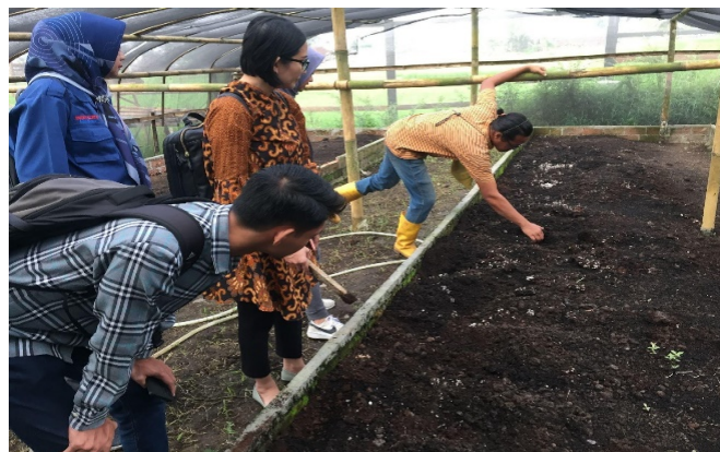
Gambar 3. Pengecekan kolam cacing

Kharrsa Farm memulai pemeliharaan cacing tanah pada tahun 2021. Pemeliharaan cacing tanah dimulai dengan 3 kolam pemeliharaan cacing dengan besar masing masing kolam 8m x 2m. Kolam pemeliharaan dibuat menggunakan batu bata sebagai kerangka. Kolam pemeliharaan yang kuat akan mencegah cacing kabur dari tempat pemeliharaan. Kolam cacing dibangun di bawah paranet untuk melindungi cacing dari paparan sinar matahari secara langsung, yang menjaga media selalu dalam keadaan lembab. Nurmaningsih dan Syamsussabri (2021) menyatakan bahwa cacing dengan media yang lembab lebih berkembangbiak daripada cacing dengan media kering. Media pemeliharaan yang digunakan berasal dari limbah domba yang diperoleh dari peternakan domba milik Kharrsa Farm. Limbah yang digunakan sebagai media pemeliharaan lebih baik difermentasi selama 2-3 hari sebelum diberikan kepada ternak. Limbah domba/kambing memiliki tekstur yang sangat keras, sehingga perlu dilakukan fermentasi untuk melunakkan tekstur limbah. Cacing membutuhkan media atau pakan yang lunak agar mudah diserap oleh cacing tanah.