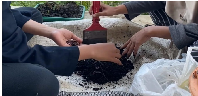
Gambar 6. Pembersihan cacing tanah

Cacing yang digunakan untuk bahan dasar tepung adalah cacing yang sudah memasuki masa panen pada umur 4 bulan. Cacing yang sudah dipanen dibersihkan dengan memisahkan cacing tanah dari media yang masih menempel menggunakan kuas. Setelah pemisahan media, cacing dicuci untuk memastikan tidak ada media yang menempel pada tubuh cacing.