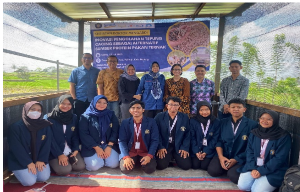
Gambar 4. Pelaksanaan Penyuluhan

Guna meningkatkan pengetahuan peternak mengenai inovasi pengembangan produk cacing tanah, tim doktor mengabdikan melakukan penyuluhan mengenai pemanfaatan cacing tanah sebagai sumber protein alternatif pakan ternak. Cacing tanah memiliki kandungan protein yang cukup tinggi sehingga dapat digunakan sebagai bahan baku pakan ternak. Cacing tanah memiliki kadar protein yang relatif tinggi, berkisar antara 58 hingga 71% (Sardi, dkk., 2023). Menurut Aslamyah dan Karim (2013) cacing tanah memiliki kandungan protein kasar sebesar 60-72%, lemak 7-10%, abu 8-10%, dan energi 900-1400 kalori. Kandungan nutrisi yang dimiliki cacing tanah berpotensi menjadi pakan sumber protein yang ekonomis bagi ternak.