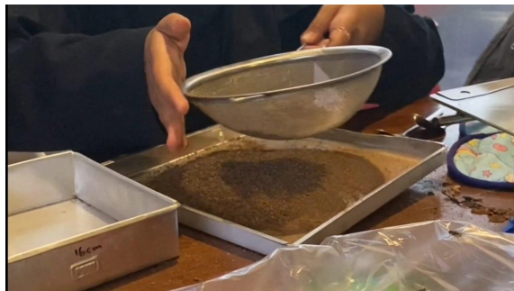
Gambar 10. Penghalusan cacing

Cacing yang sudah kering dihaluskan sampai berbentuk butiran tepung. Penghalusan cacing kering dapat dilakukan secara manual menggunakan tumbukan atau dengan alat blender atau grinder . Penghalusan dengan cara manual dan berulang-ulang memiliki kekurangan yaitu menghabiskan tenaga dan waktu sehingga tidak bisa menghasilkan produk dengan jumlah banyak secara singkat (Nurdin, dkk. 2022). Apabila ingin menghasilkan tepung cacing lebih banyak dapat menggunakan grinder /blender untuk hasil yang maksimal.