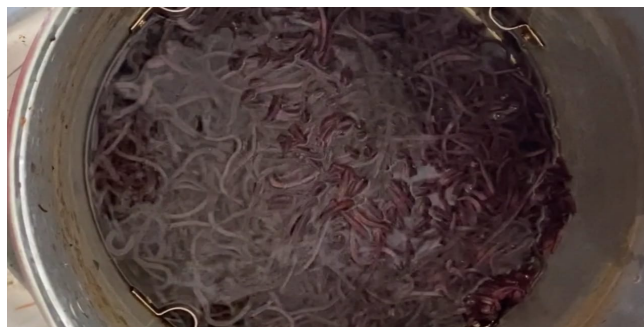
Gambar 7. Perebusan cacing tanah

Cacing yang sudah bersih, direbus dalam air mendidih selama 2 menit. Air yang digunakan untuk perebusan tidak terlalu banyak karena penggunaan air yang berlebih dapat melarutkan mineral dan vitamin yang terkandung dalam cacing tanah. Pembuatan tepung cacing memerlukan perebusan/pengukusan untuk memisahkan lendir cacing (Pranata, dkk. 2023). Lendir dipisahkan dari tubuh untuk memudahkan keluarnya air dalam tubuh cacing serta memudahkan proses pencernaan tepung.