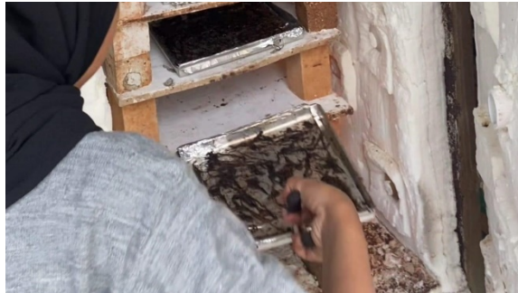
Gambar 9. Pengeringan cacing

Cacing tanah yang telah dijemur dimasukkan ke dalam oven. Proses pengeringan menggunakan oven dilakukan selama 4 jam dengan suhu 50 C. Pengeringan dengan suhu yang terlalu tinggi akan menyebabkan bagian dalam cacing masih basah, sehingga tidak dapat kering secara merata. Kasus ini disebut case hardening dimana produk hanya keras di luar permukaan (Asiah, dkk. 2020).